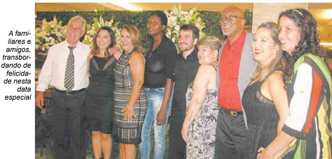
A familiares e amigos, transbordando de felicidade nesta data especial