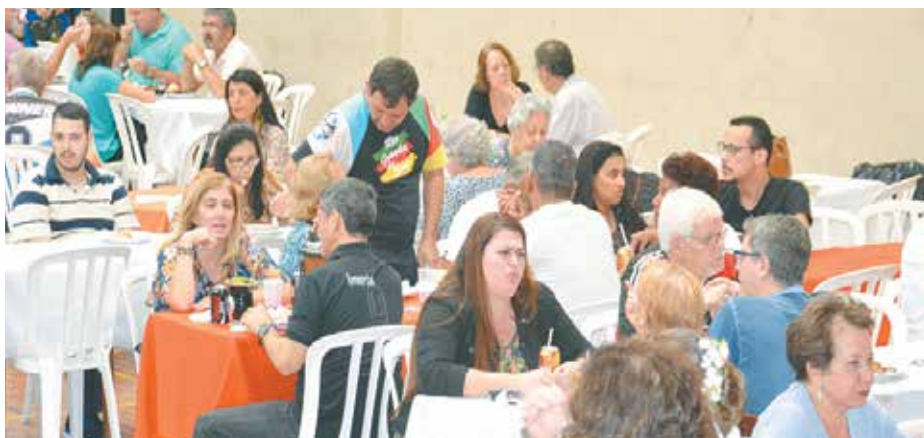
Panorâmica da última Festa Gaúcha do ano, na Casa do Minho com o ginásio, sempre recebendo muitos amigos

tes do mês. Um dia perfeito e quem não foi perdeu, agora só em 2017 com força total.