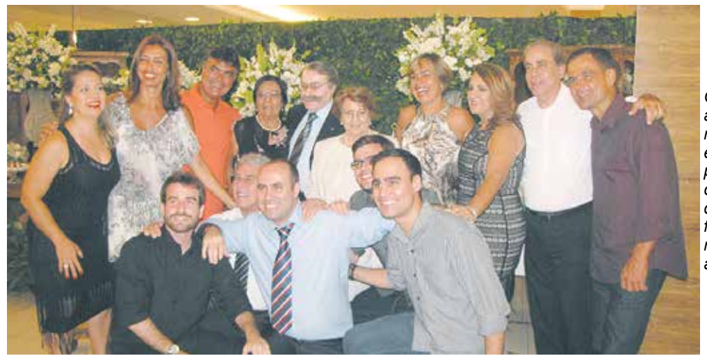
O casal aniversariante foi envolvido pelo carinho dos seus familiares e amigos

pois nenhum outro acontecimento, envolvendo vidas humanas é tão significativo como esse. Portanto, ao casal "diamantado", só me resta dizer "parabéns!", desejando que a paz que emana de seus corações, contagie as demais gerações, a fim de que elas possam seguir esse belo exemplo de união que eles nos deixam como legado indispensável à prática do amor na vida a dois.