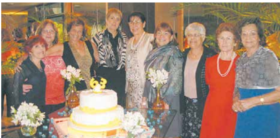
Bonita imagem do Departamento Feminino da Casa das Beiras, diante do bolo comemorativo do 63.º aniversário da Casa