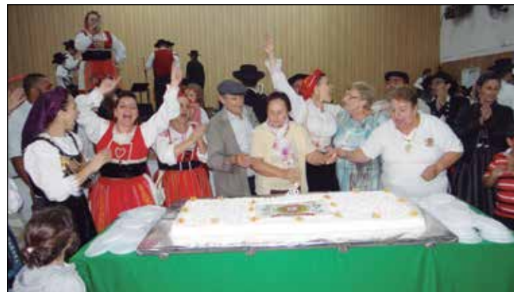
O "Parabéns a Você" e o corte do bolo.