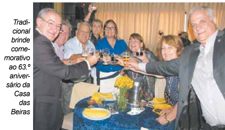
Tradicional brinde comemorativo ao 63.º aniversário da Casa das Beiras