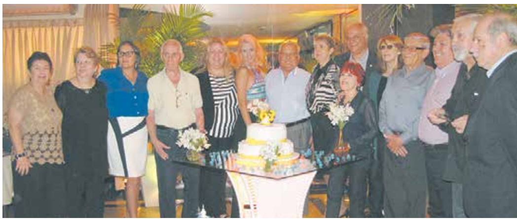
A diretoria da Casa das Beiras, reunida para festejar mais um ano de fundação