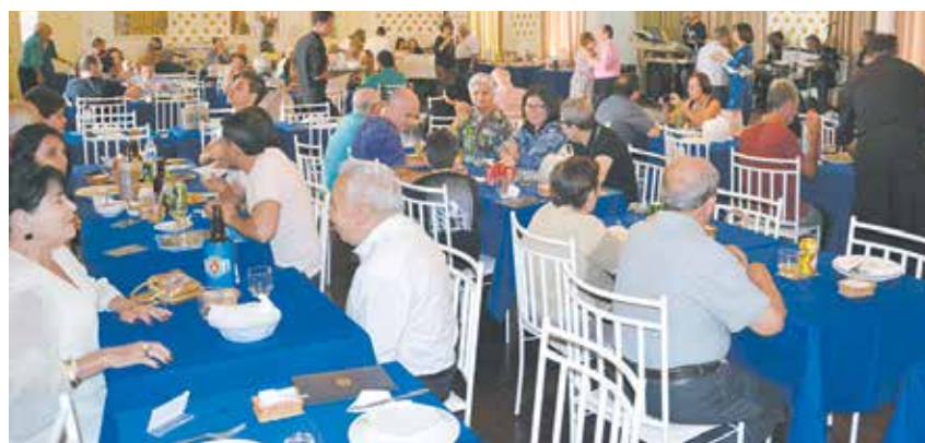
Aspecto do salão feirense, lotado, com associados e amigos curtindo o som do Conjunto Som e Vozes e a maravilhosa gastronomia da Casa

Um dia maravilhoso, na Casa da Vila da Feira, com os amigos marcando presença, em peso, para curtir mais um domingo mágico, com muita alegria e descontração, boa música e uma gastronomia de primeira qualidade, tudo de bom, uma verdadeira “casa portuguesa, com certeza”.