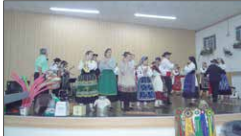
Aqui a atuação do visitante Grupo Folc. da Associação Atlética Portuguesa.