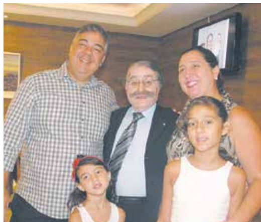
Amigos envolvendo Lopes de carinho