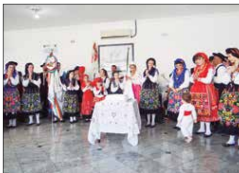
Instante do Parabéns a Você.