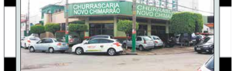
Caro amigo se não conhece vale a pena ir conhecer a Churrascaria Novo Chimarrão, ali no Bairro da Vila Guilherme. Picanha fenomenal e bacalhau estupendo...Vá conferir...