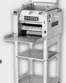
Cilindro Sovador Laminador