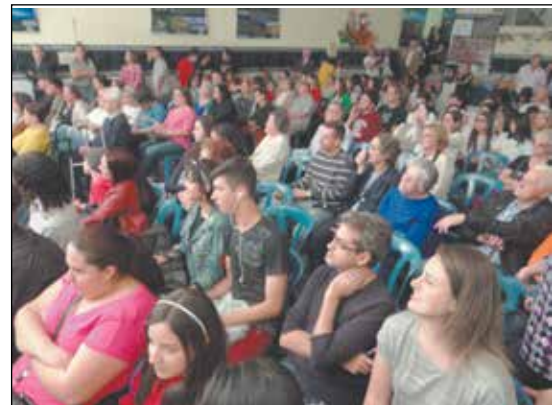
Detalhe de muitos presentes.