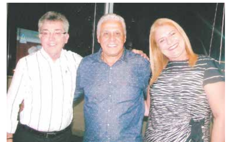
Roberto Dinamite numa pose com o casal da Casa Coqueiro