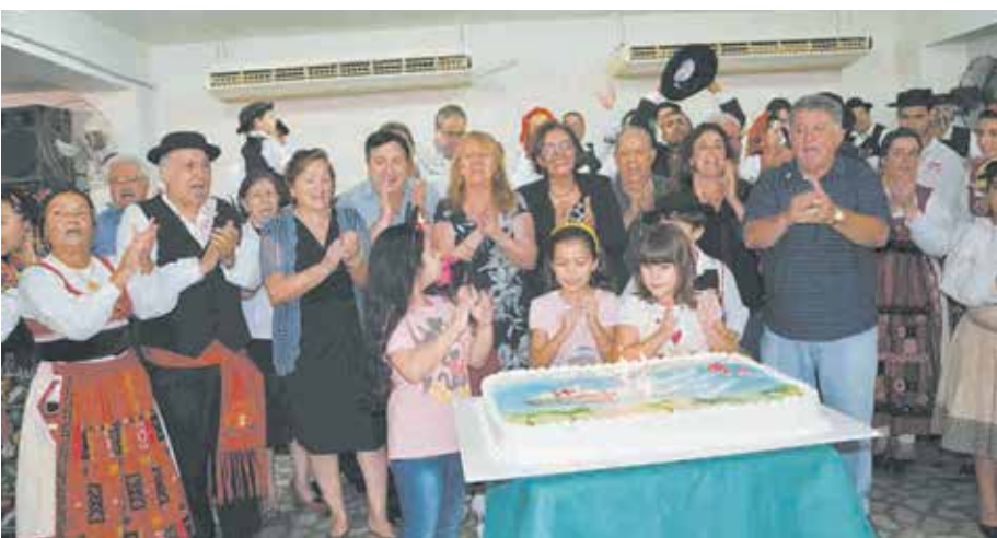
Bela foto do bolo comemorativo ao 34.º aniversário do R.F. Luiz Vaz de Camões com diretores e componentes do Rancho aniversariante