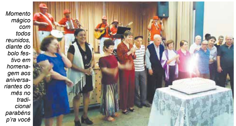
Momento mágico com todos reunidos, diante do bolo festivo em homenagem aos aniversariantes do mês no tradicional parabéns pra você