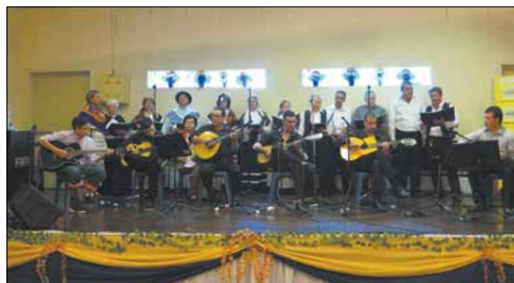
Coral Cantares do Basalto e tocatá do Grupo Folclórico da Casa dos Açores.