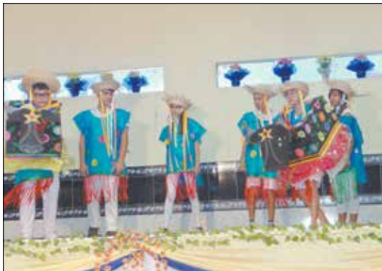
Dança Bumba Meu Boi, com alunos da Escola Santa Marina.