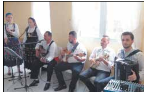
Tocata do Rancho Raizes de Portugal animando a festa.