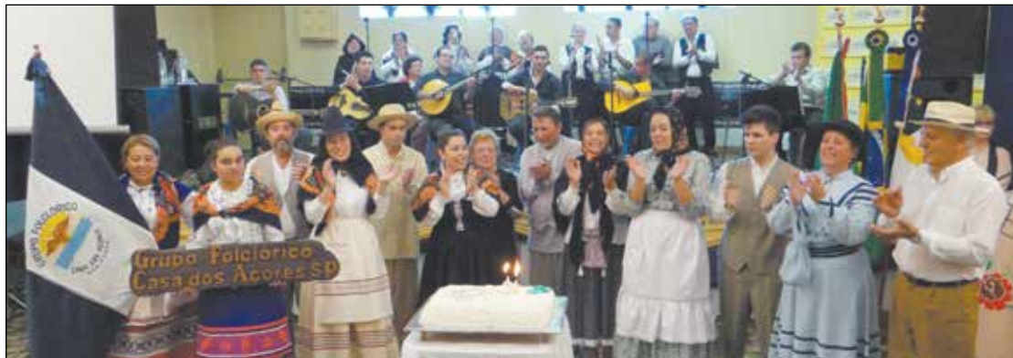
Grupo Folclórico da Casa dos Açores comemorando 35 anos de existência a serviço dos Açores.