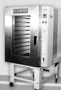
Forno Turbo a Gás