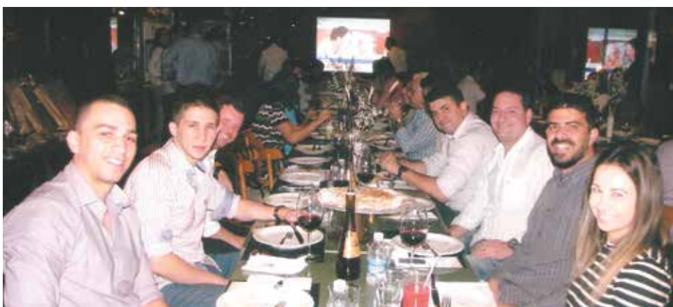
Amigos da Rede Supermarket, nesta noite festiva