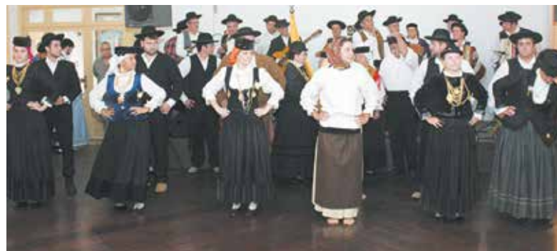
Rancho Folclórico do Arouca Barra Clube, convidado na festa de aniversário do Grupo Folclórico Padre Tomaz Borba fez uma linda apresentação