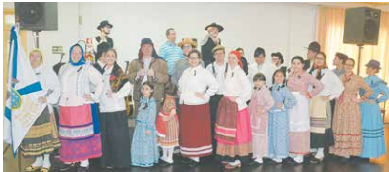
Grupo Folclórico Padre Tomaz Borba, numa pose festiva, alusiva ao seu 62.º aniversário de fundação