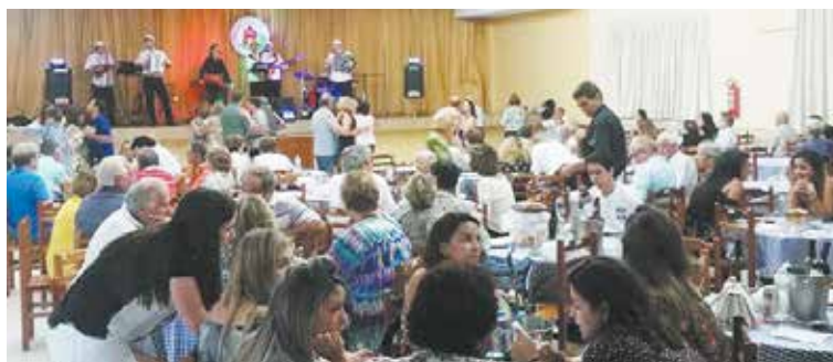
Convívio social Visiense esteve bem movimentado com o conjunto Amigos do Alto Minho dando seu show particular

Um domingo bem movimentado, na Casa do Distrito de Viseu, na Vila da Penha com a realização do tradicional almoço, churrasco com direito a picanha, sardinha portuguesa na brasa, febras, filé de peixe "a doré", filé de frango. Só coisa boa, além de deliciosos vinhos portugueses e da boa música com o conjunto Amigos do Alto Minho que deram o toque alegre da tarde.