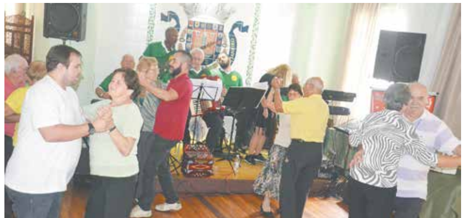
O Solar Portuense transformou-se numa verdadeira passarela de bailarinos, que alteravam o almoço com a diversão

Bateu aquela fominha? (21) 3351.3988 (21) 3391.0108