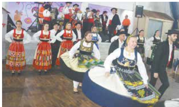
Mais uma bela exibição do Rancho Folclórico Maria da Fonte, no Arraial Minhoto, mostrando toda sua categoria no bailado regional do norte de Portugal

Todos os presentes puderam apreciar, nesta noite as brincadeiras dos bonecos “Os Gigantones” ao som dos Zés Pereiras, seguido das marchinhas luminosas.