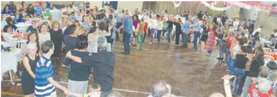
Quinta de Santoinho, uma festa maravilhosa na Casa do Minho, fazendo parte do calendário turístico do Rio de Janeiro