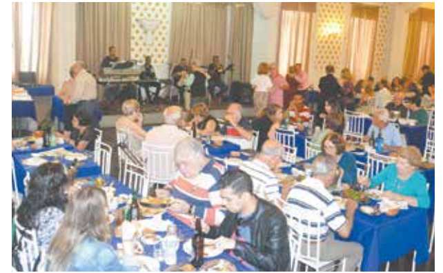
Panorâmica do salão feirense, sempre repleto com o som do Conjunto Som e Vozes, com convidados, degustando o bom paladar da comida regional