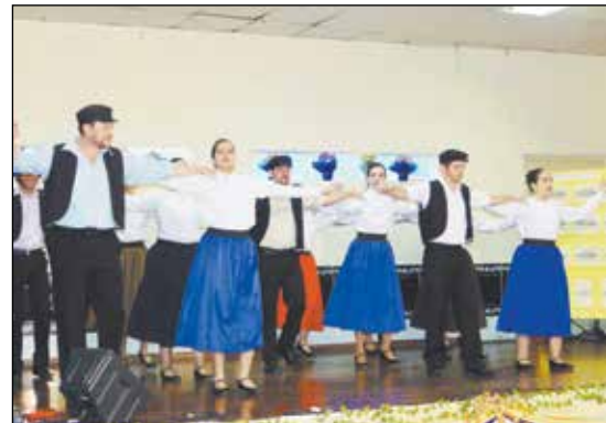
Grupo Zorbás de Dança Grega.