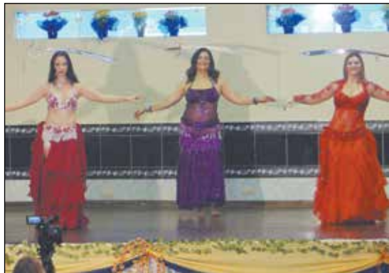
Cia de Danças Nefertari, dança do ventre, dança cigana e flamenca.