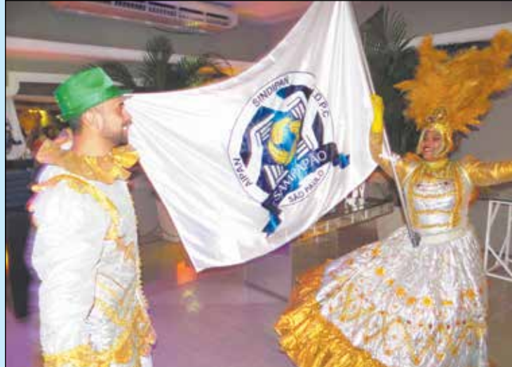
A animação esteve a cargo do Grupo de Samba Brazilian Show aqui com o porta estandarte do SAMPAPÃO.