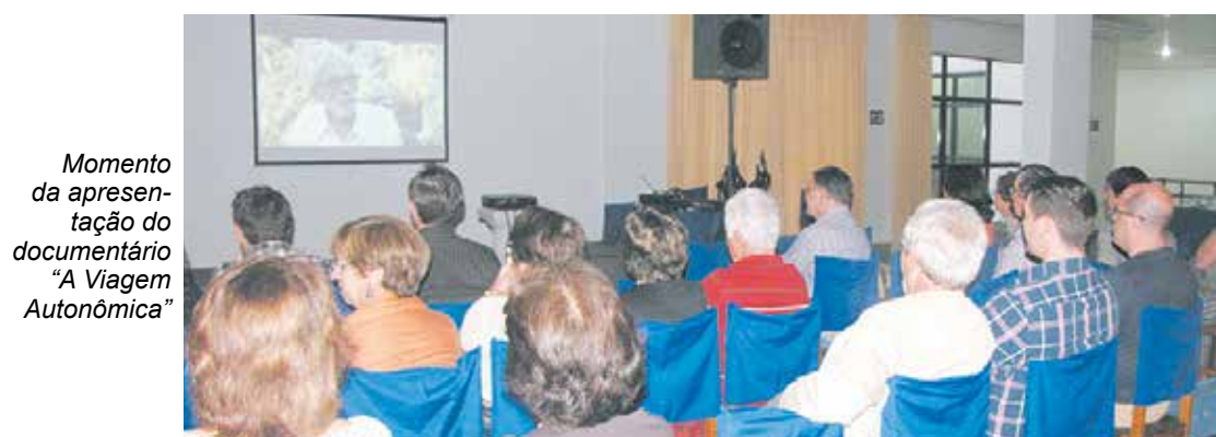
Momento da apresentação do documentário "A Viagem Autônômica"