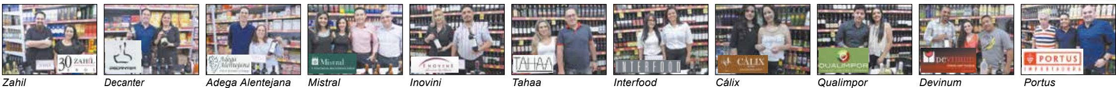
Zahil Decanter Adega Alentejana Mistral Inovini Tahaa Interfood Cálix Qualimpor Devinum Portus