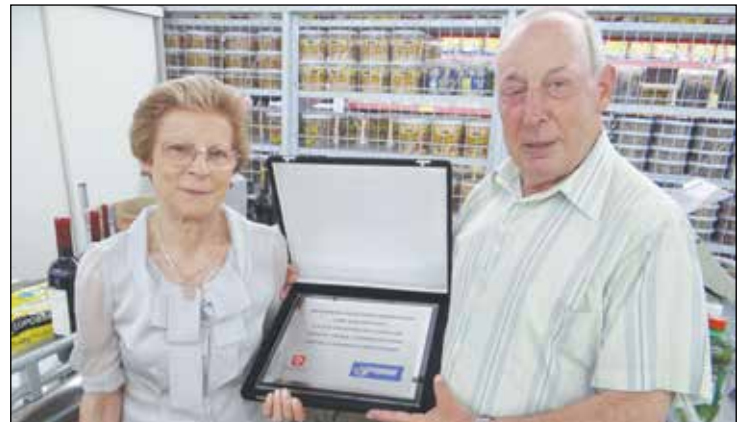
Família Jeronimo com a homenagem recebida do Banco Bradesco pelos 50 anos do Kanguru.