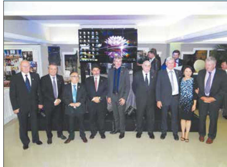
Todos os participantes do congresso de todos os países homenageados nesta noite.