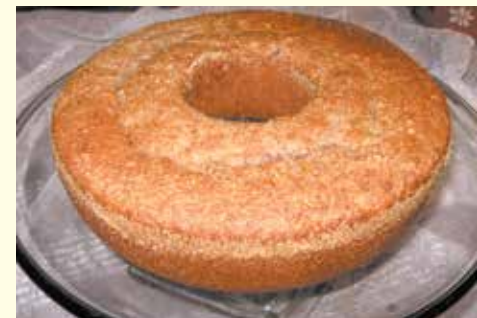
BOLO ESCURO (Convento de Santa Clara de Trancoso)

• 1 colher (chá) de canela • 1 colher (chá) de cravinho • 200 ml de azeite • 3 claras • 500 ml de mel • 6 colheres (sopa) de farinha • 6 ovos