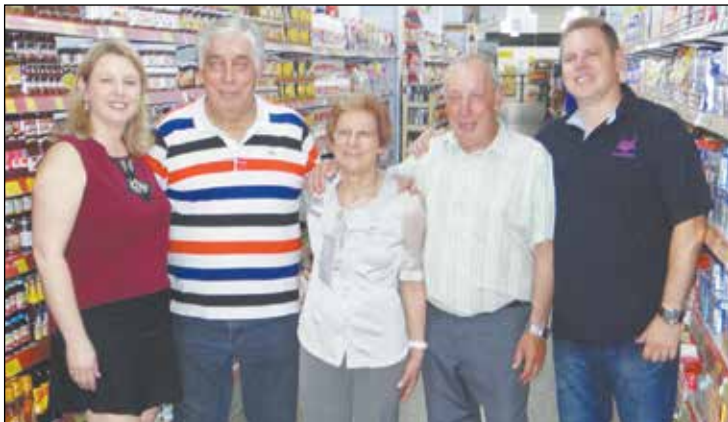
Família Jeronimo responsável pelo sucesso dos 50 anos do Kanguru Supermercado.

os presentes ao 16.o Wine Night, uma linda taça de cristal personalizada. Vá você também conhecer o Supermercado Kanguru e sua Mega Adega. Esté sempre aberta segunda a sábado, das 8.30 às 20 horas, e está localizada à Rua Antonio de Barros, 285 no Tatuapé, estacionamento próprio com manobristas. Fones 2296.6111 - 2296.4569 - 2942.8877. Visite o site www.kangurusupermercado.com.br ou www.megaadega.com.br a sua melhor opção em compra de vinhos pela internet.