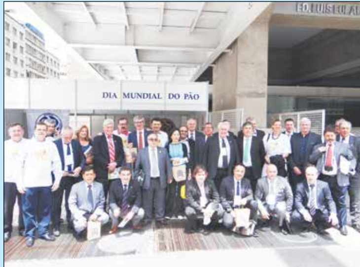
Diretoria do SAMPAPÃO e integrantes do UIBC no Dia Mundial do Pão na Avenida Paulista.