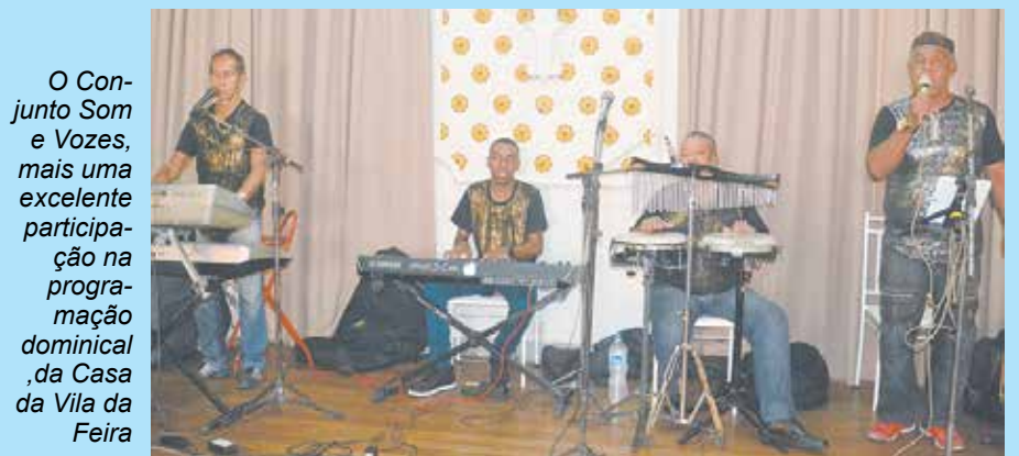
O Conjunto Som e Vozes, mais uma excelente participação na programação dominical da Casa da Vila da Feira

Bateu aquela fominha? (21) 3351.3988 (21) 3391.0108