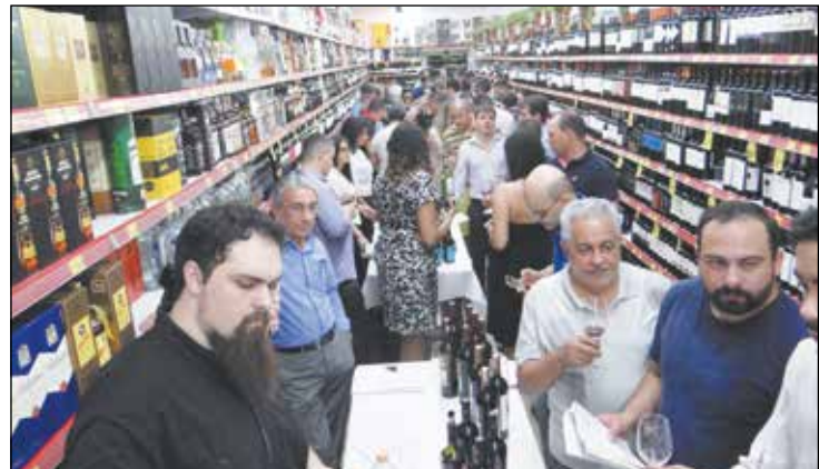
Flagrante da Mega Adega Kanguru.