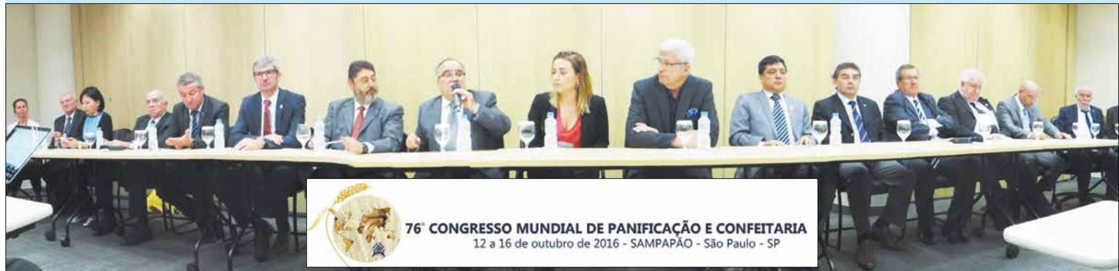
Flagrante da coletiva de imprensa na FIESP.