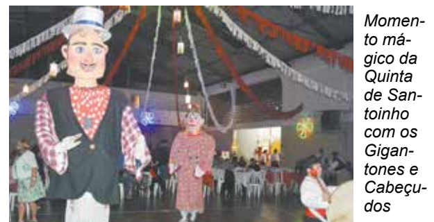
Momento mágico da Quinta de Santoinho com os Gigantones e Cabeçudos