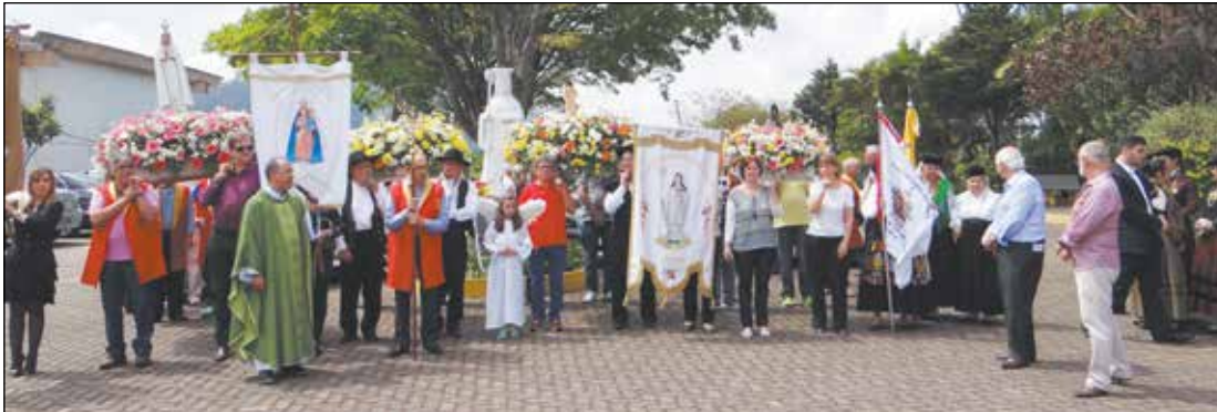
A frente da estatua da Rainha Santa Mafalda vemos o termino da procissão.

bem vindo coquetel. Na continuidade foi servido a todos os presentes, aquele delicioso bacalhau à moda de Arouca sempre esbanjando qualidade e fartura. O Rancho Folclórico do Arouca São Paulo Clube, mais uma vez cuidou da animação desta tarde com um alegre vira livre, e na continuidade exibiu modas do rico repertório arouquense percorrendo todas as freguesias de Arouca. Anote aí, o próximo evento do Arouca será no dia 16.10 um almoço beneficente e dia 05.11.2016 Grande Noite Portuguesa com Roberto Leal.