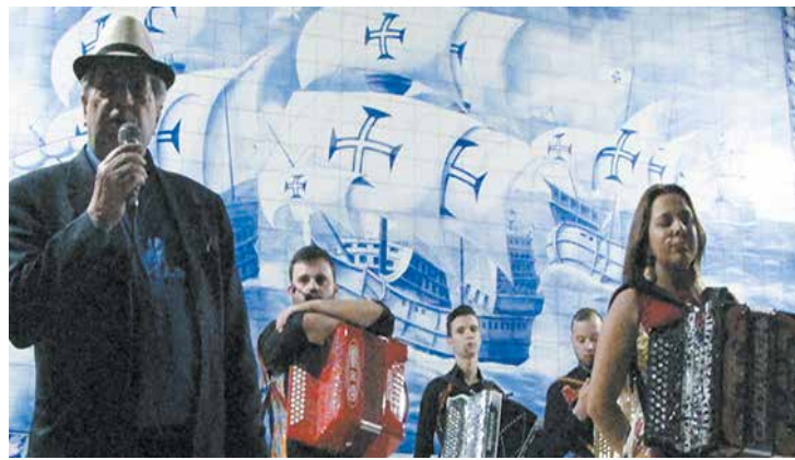
O Presidente da Casa do Minho quando parabenizava o Grupo Marotos Minhotos e Marotos e saudava os amigos presentes