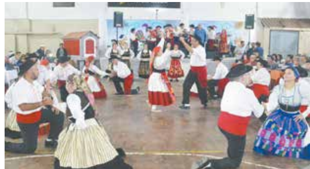
Mais um lindo espetáculo do R.F. Veteranos, da Casa do Minho, no último sábado, na Quinta de Santoinho

Assim, a noite do passado sábado, a Quinta de Santoinho foi mais uma vez abrilhantada pelo R.F. Veteranos da Casa do Minho para defender as tradições da terra distante, perpetuando as novas gerações, os costumes