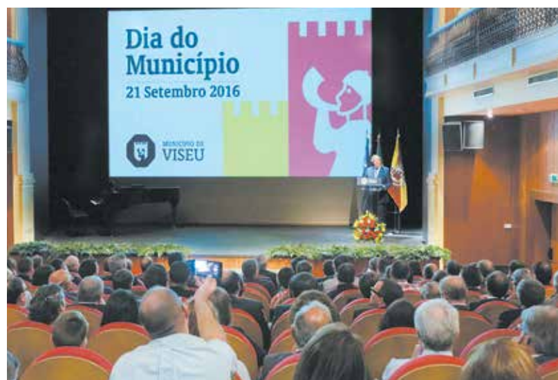
Bonita imagem do teatro Viriato no último dia 21 de setembro na festa comemorativa do aniversário do Município de Viseu, completamente lotado com autoridades e convidados e o Jornal Portugal esteve presente neste dia especial