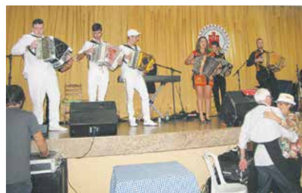
Junto no palco da Casa de Viseu, o Conjunto Amigos do Alto Minho e o Grupo Minhotos Marotos

um cardápio da melhor qualidade e muito bom gosto, aquele churrasco de picanha, opção de sardinha, filé de peixe à doré, purê de batata, filé de frango à milanesa e uma deliciosa mesa de frutas e gostosos pratos da culinária visiense. Animando o almoço social, o excelente Conjunto Amigos do Alto Minho, abrindo os trabalhos musicais para