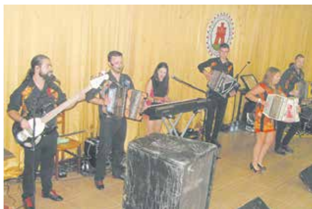
Belíssima estréia da turnê dos Minhotos Marotos no Brasil,