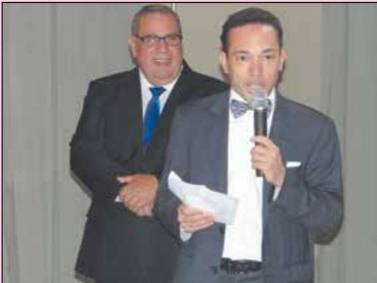
Instante da homenagem do Tio Vinícios.