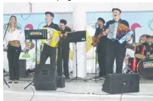
O Conjunto Amigos do Alto Minho, sempre dando a qualidade musical, na Quinta de Santoinho

E a Quinta de Santoinho, continua sendo uma das boas atrações todo o primeiro sábado de cada mês.