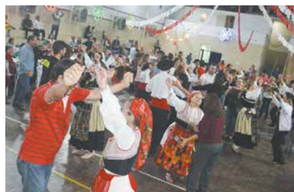
O tradicional "vira livre" com os componentes do Rancho e o público na Quinta de Santoinho

dos avós, que não esqueceram. Depois vieram as Marchas Luminosas e foi assim, no último sábado, onde se pode ainda levar a família, beber sem excessos, comer e dançar, entre amigos e fazendo novas amizades que se perduram pela vida. Numa Casa Regional Portuguesa, com certeza!