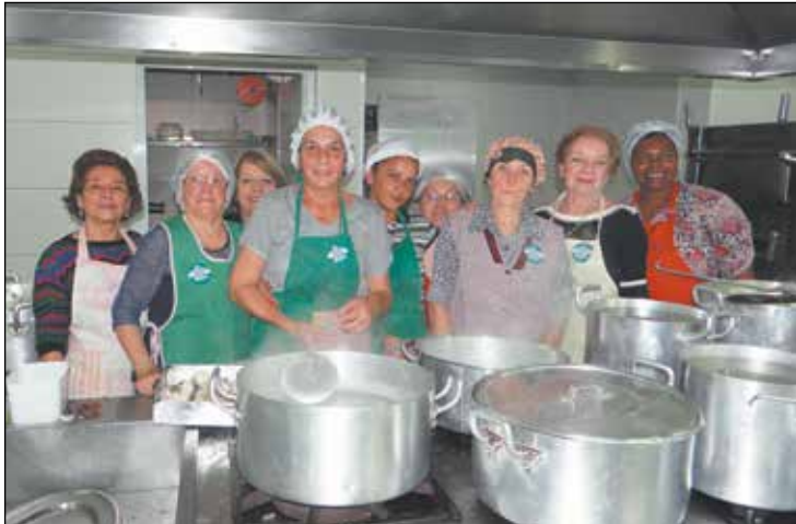
Aqui vemos as responsáveis pela gastronomia maravilhosa deste dia.

feita daquele dia, iniciando com a conhecida musica o Tiro Liro, as Malapas, Bailinho da Madeira, a aguardada Arrebenta a Festa, a Festa (dos Mamonas), Verde Vinho, Moreninha Linda que levantou os presentes, o Hino das Padarias, Minha Aldeia, o Hino de Portugal tendo à guitarra o Rodrigo Leal filho do ídolo que naquele dia estava na bateria, Vira Virou entre outras tantas e encerrou com o "Arrebenta a Festa".