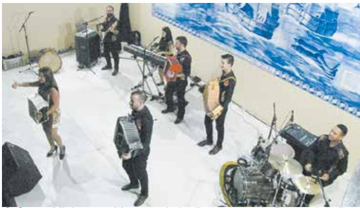
O Grupo Minhotos e Marotos vindo diretamente de Portugal realizou um belo show de estreia no Rio