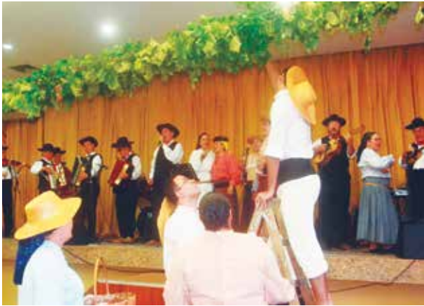
Momento quando eram realizadas as vindimas, no almoço de aniversário da fusão da Casa de Viseu e o Clube Português do Rio de Janeiro