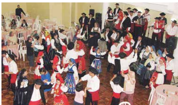
Os componentes do Grupo Folclórico Maria da Fonte brindaram o público com uma linda apresentação, e dançaram com o público presente o vira livre