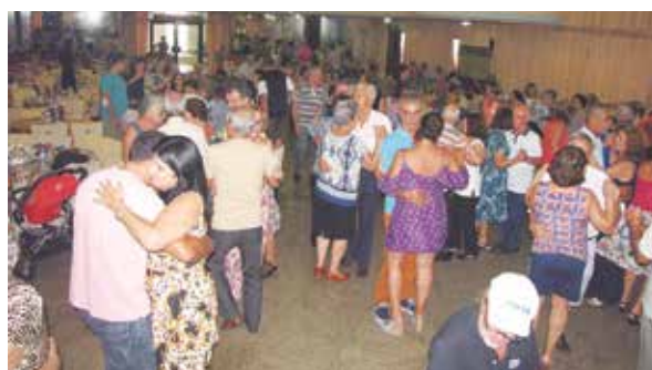
Panorâmica do salão social da Casa das Beiras, sempre recebendo um excelente público

ganização e competência, proporcionando um dia especial para seus associados, amigos e aniversariantes com direito a bolo, valsa e parabéns para você com a banda TB Show que deu o toque musical à tarde festiva . Um