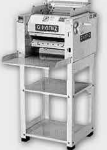
Cilindro Sovador Laminador