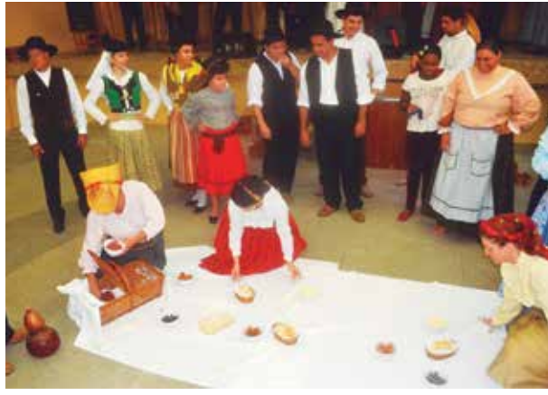
Muita emoção após a vindima, quando os componentes do R.F. da Casa de Viseu, realizavam a merenda, tradicional neste tipo de evento