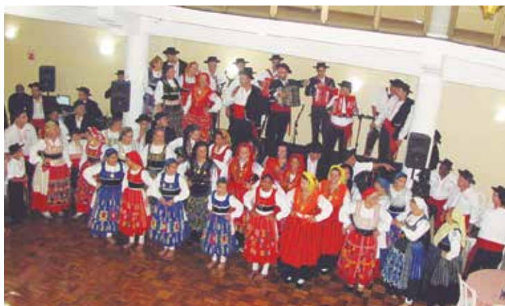
Momento de muita emoção, todos os componentes dos Ranchos da Casa do Minho reunidos para os parabéns de 91 anos desta Casa Regional