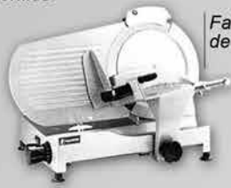
Fatiador de Frios