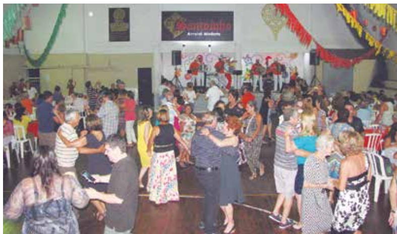
O Conjunto Amigos do Alto Minho deu o ritmo musical ao Arraial Minhoto, agitando o salão