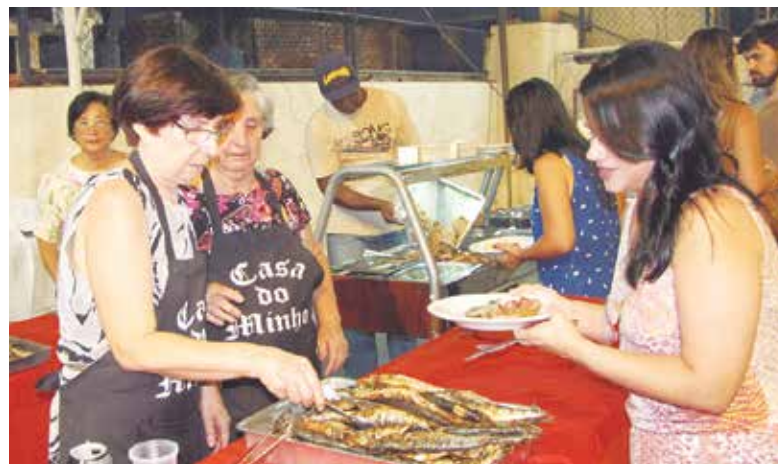
Um show de gastronomia da Quinta de Santoinho com tudo que há de melhor da tradição minhota