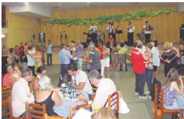
Panorâmica do almoço viseiense de confraternização de aniversário da fusão com o Clube Português do Rio de Janeiro