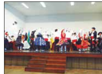
O convidado deste dia o Rancho Folc. Verde Gaio do Centro Cultural Português de Santos.