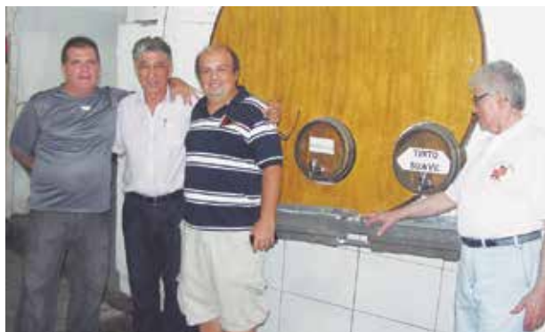
A diretoria da Casa do Minho deu um show de competência e simpatia no Arraial Minhoto. Aqui, diretores prontos para servir os deliciosos vinhos