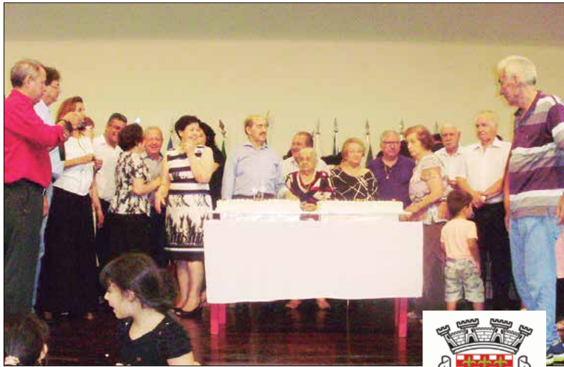
Instante do "Parabéns a Você".