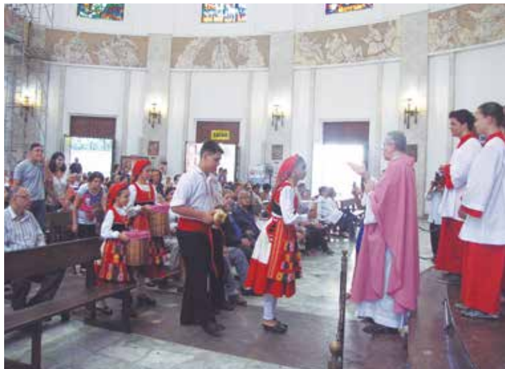
Os componentes do R.F. Maria da Fonte, durante o ofertório na Missa de Ação de Graças do aniversário da Casa do Minho