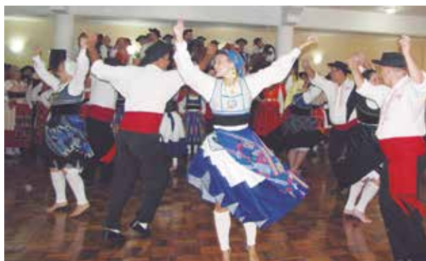
O Rancho Maria da Fonte realizou uma linda apresentação, neste domingo de aniversário minhoto