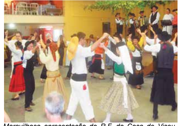
Maravilhosa apresentação do R.F. da Casa de Viseu, dando um show na sua apresentação, neste dia tão importantes para as duas Casas Regionais