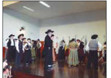
Exibição do Rancho Folc. Arouca São Paulo Clube.