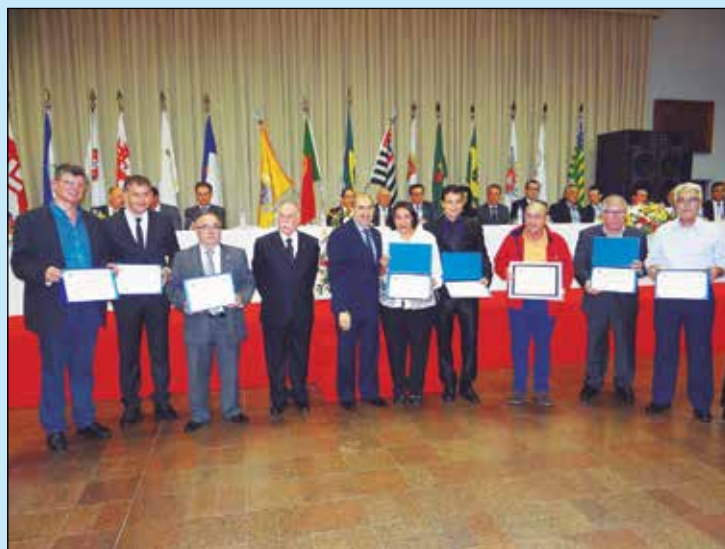
Aqui todos os homenageados pela Câmara Municipal de São Paulo.