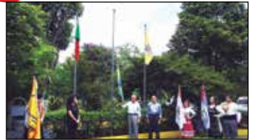
Momento do hasteamento das bandeiras.