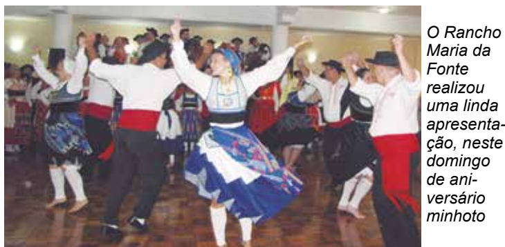
O Rancho Maria da Fonte realizou uma linda apresentação, neste domingo de aniversário minhoto