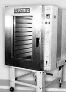
Forno Turbo a Gás