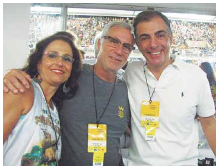
Numa pose especial curtindo o samba na Marquês de Sapucaí um trio da pesada