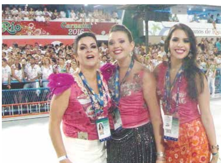
Numa pose especial, na passarela do samba, a exuberância e carisma do charme feminino da família Rios.

berância e simplicidade de todos que compareceram, extravasando sua alegria e satisfação ao lado dos familiares, nestes três dias de folia e no desfile das campeãs, encerrando com chave de ouro o carnaval carioca e o Jornal Portugal em Foco se fez presente neste momento e traz em suas páginas a cobertura completa desta festa maravilhosa, uma das mais lindas que o nosso povo realiza com muita competência e prazer.