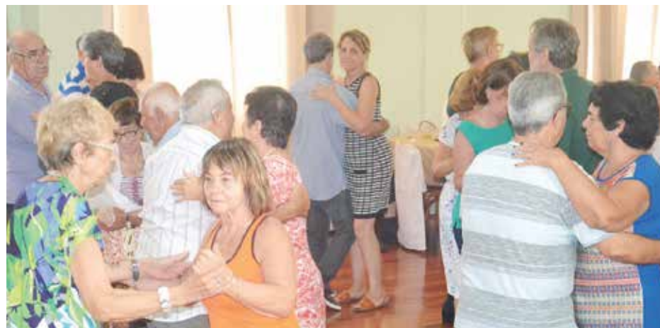
Essa turma agita o salão portuense sempre mostrando os dotes de bons dançarinos