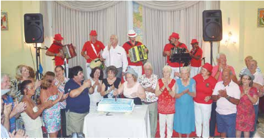
Momento dos parabéns para os aniversariantes presentes, no Convívio Transmontano, no domingo passado