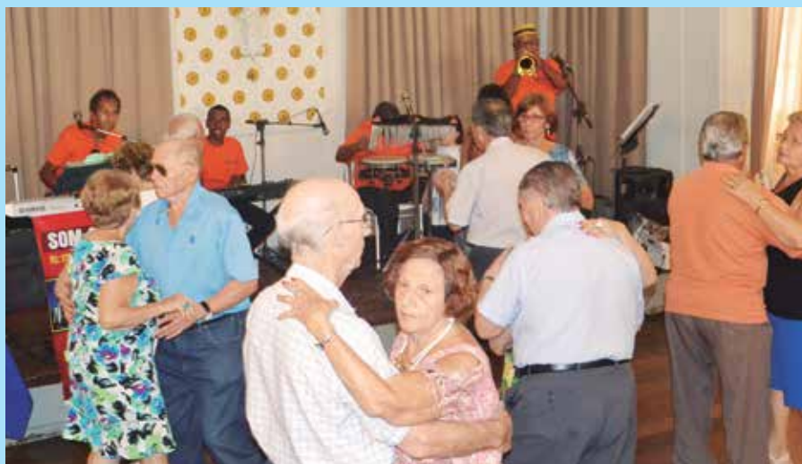
O Conjunto Som e Vozes, sempre com um repertório de primeira, agitando o público, em mais um domingo de convívio social feirense