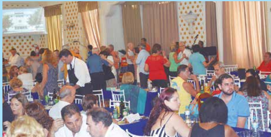
Panorâmica do salão social feirense e como sempre com uma boa lotação, tendo em vista os saborosos pratos servidos aos domingos

a deliciosa gastronomia feirense, uma das mais conceituadas em Portugal. Não podemos deixar de destacar a cordialidade dos diretores e as senhoras do Departamento Feminino, todos sempre atenciosos com os amigos, associados e convidados.