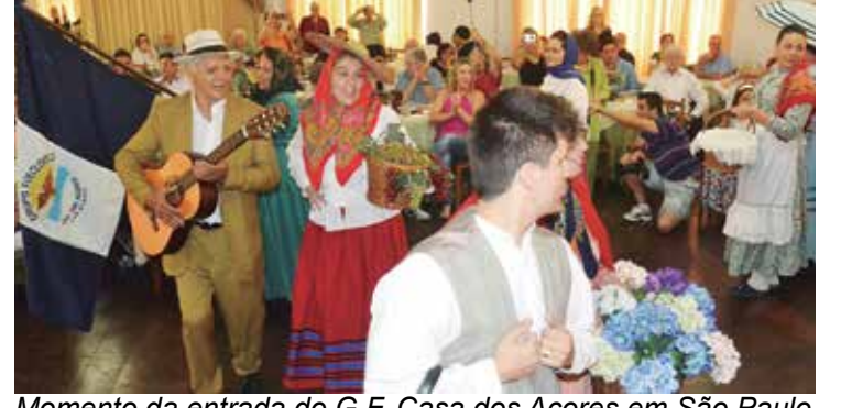
Momento da entrada do G.F. Casa dos Açores em São Paulo para realizar sua apresentação