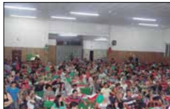
Detalhe do salão lotado