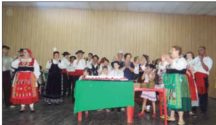
Instante do "Parabéns a Você" e o corte do bolo.