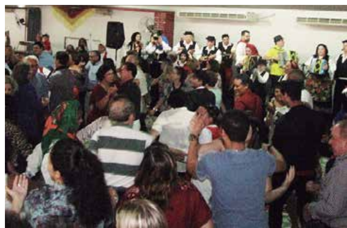
Uma empolgação no momento do tradicional vira-livre com o público dançando com o R.F. Luiz Vaz de Camões

Um grande domingo proporcionado pela diretoria do Clube Português de Niterói aos seus associados, amigos e amantes do folclore, pois realizou uma grande festa do 33.º aniversário do Grupo Folclórico Luiz Vaz de Camões e nada como um almoço festivo completo liberado com churrasco, rojões, sardinha assada na brasa. O toque musical esteve com o Conjunto sensação do momento Cláudio San-