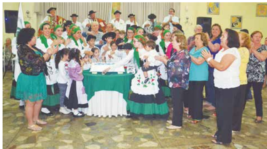
Linda imagem dos componentes do R.F. Guerra Junqueiro, reunidos diante do bolo festivo com diretores e familiares