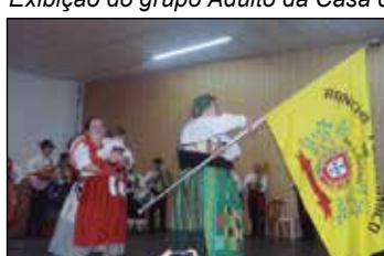
A entrada do grupo Folc. Da Casa de Brunhosinho.