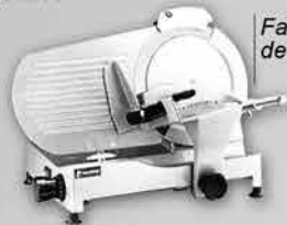
Fatiador de Frios