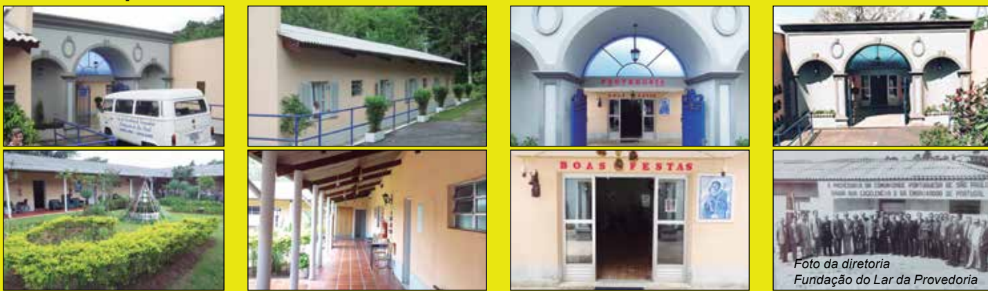
Foto da diretoria Fundação do Lar da Provedoria