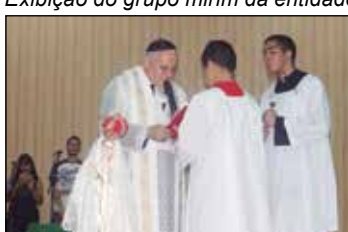
Instante da celebração da santa missa.