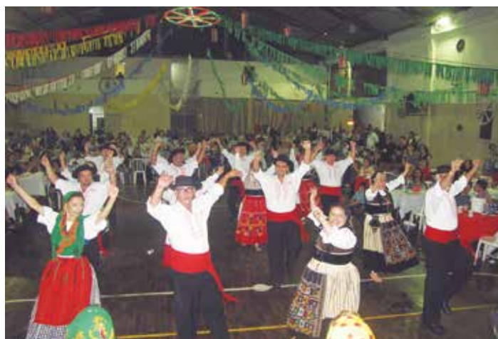
O Rancho de Veteranos Maria da Fonte é sempre uma atração à parte e mais uma vez brilhou na Quinta de Santoinho

Só indo à Casa do Minho para entender o que é uma verdadeira Quinta de Santoinho.