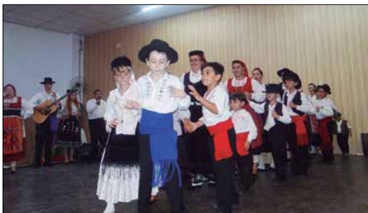
Exibição do grupo mirim da entidade.