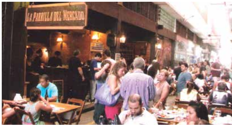
Uma das sensações do 3.º Festival de Gastronomia do Cadeq sem dúvida nenhuma o Restaurante La Parrilla Del Mercado, com os clientes saboreando um verdadeiro manjar dos deuses