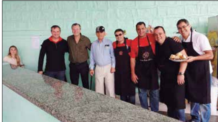
A equipe de trabalho.