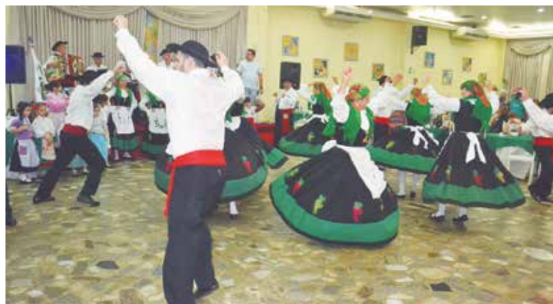
Um verdadeiro espetáculo a apresentação da moçada do R.F. Guerra Junqueiro