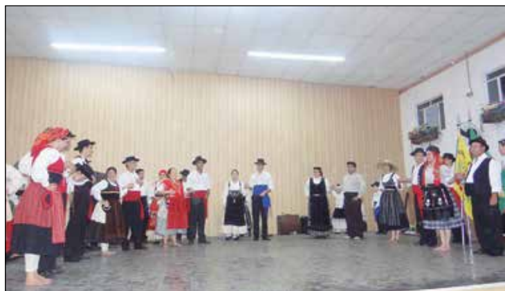
Exibição do grupo Adulto da Casa de Brunhosinho.