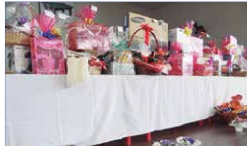
Aqui as muitas prendas distribuídas nesta tarde.