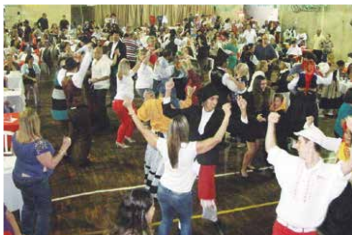
Panorâmica com os componentes do R.F. Maria da Fonte no vira livre com todos no salão