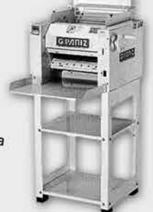
Cilindro Sovador Laminador