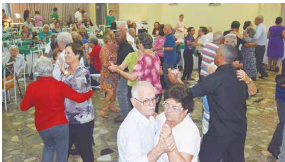
Essa turma agita o salão transmontano dando um show a parte

pelo Antonio Paiva, elaborou uma bonita programação para marcar a data, constando de um saboroso almoço, com um cardápio de primeira: churrasco completo, saladas diversas, filé de frango a parmegiana, empadão de frango,