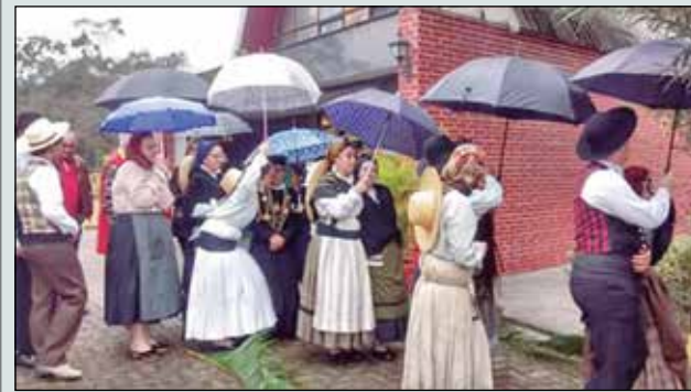
Como aqui vemos o mau tempo não é obstáculo, quando se tem fé e devoção a Sra. Da Mó. Vemos integrantes do Rancho Aldeias da Nossa Terra do Arouca São Paulo Clube, ao final da procissão debaixo de chuva.