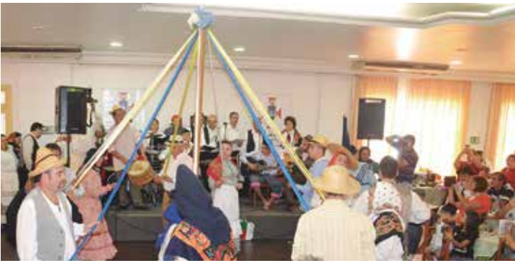
O G.F. da Casa dos Açores em São Paulo encantou o público com uma linda apresentação com seus dançares e cantares