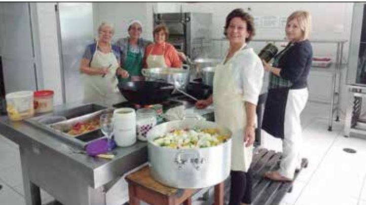
Aqui parte da laboriosa equipe da cozinha.