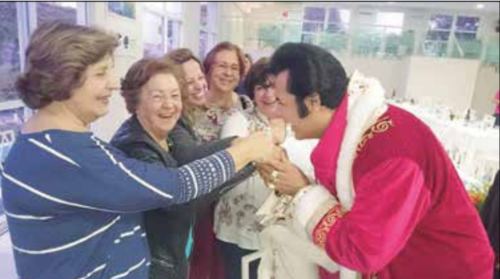
Algumas senhoras presentes com o Elvis.