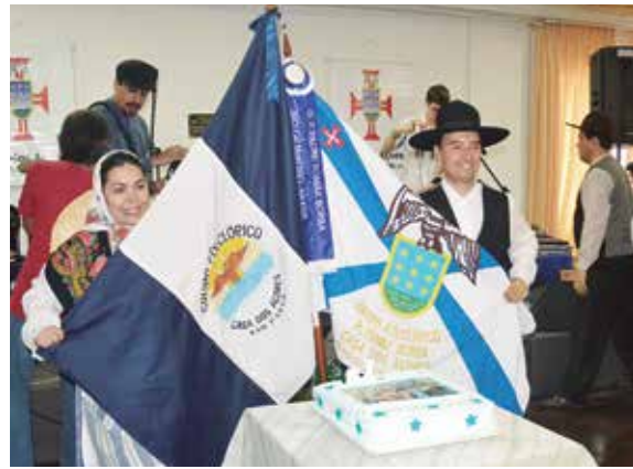
Linda imagem dos dois pavilhões dos Grupos Folclóricos da Casa dos Açores de São Paulo e do Rio de Janeiro