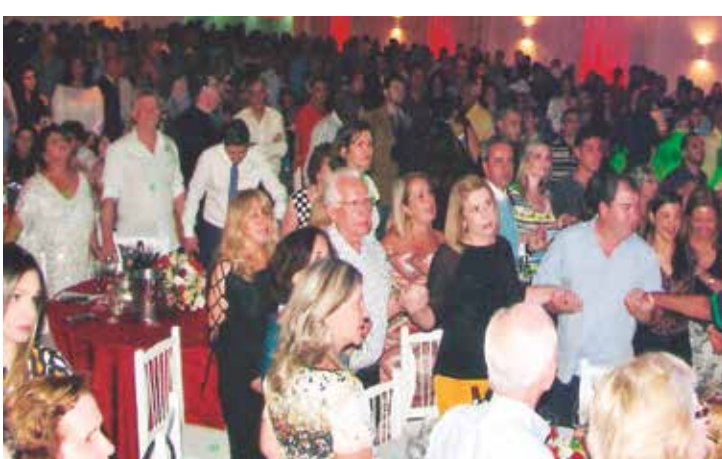
O público presente no Arouca durante o momento de fé com a confraternização unindo todos os convidados