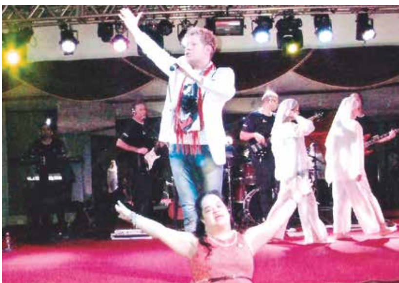
Até as crianças não resistiram ao encanto do Roberto Leal