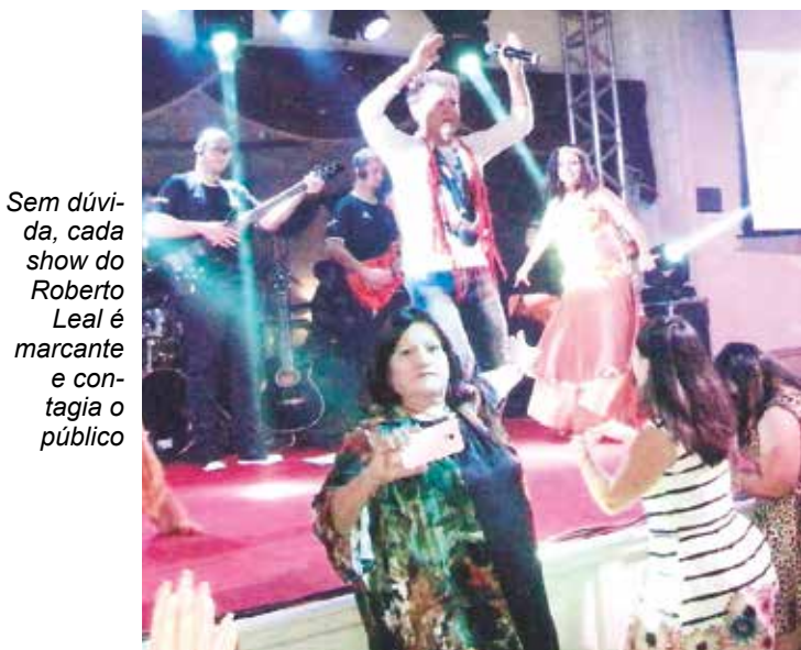
Sem dúvida, cada show do Roberto Leal é marcante e contagia o público