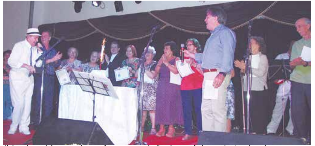
Os aniversariantes, reunidos diante do bolo comemorativo com seus diplomas, no tradicional parabéns, no almoço Arouquense dedicado aos Aniversariantes do mês