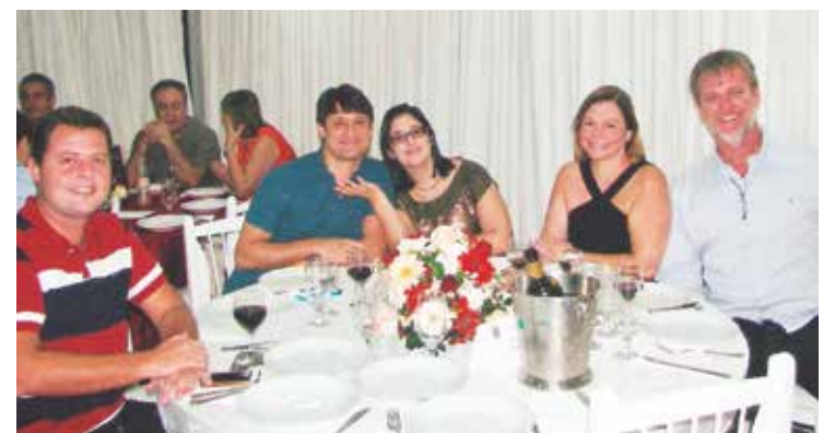
Santiago da Bunge Alimentos com familiares e amigos curtindo o show do Roberto Leal