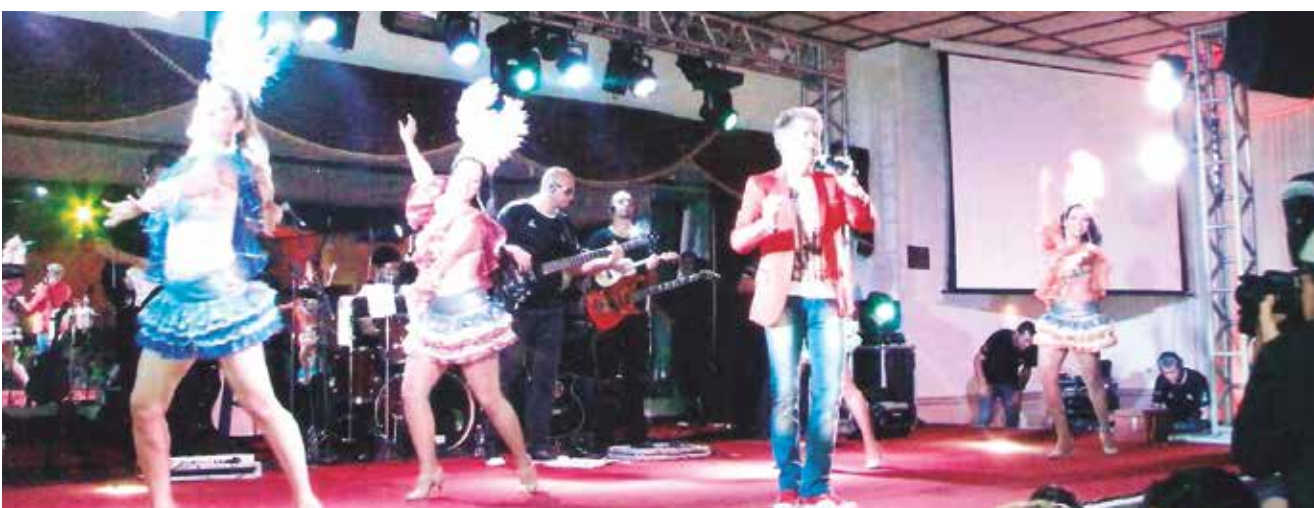
Carisma e magia é a marca do maior cantor português, nosso Roberto Leal