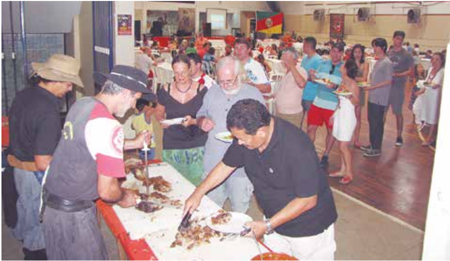
Panorâmica da continuação da Festa da Semana Farroupilha com o público saboreando a deliciosa costela gaúcha, pela fila deveria de star muito gostosa