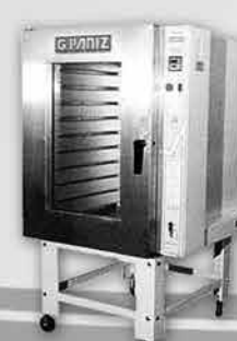
Forno Turbo a Gás