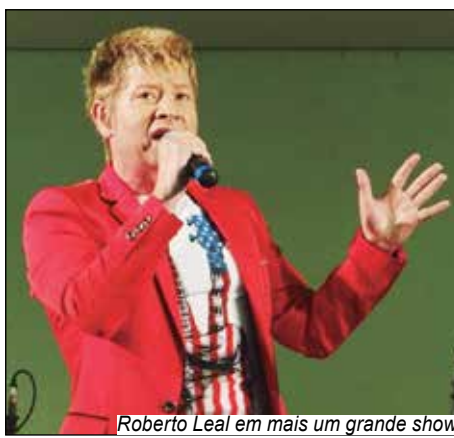
Roberto Leal em mais um grande show.

os 25 baluartes que fundaram a entidade, um grande show do cantor Roberto Leal. Este com seu carisma lusitano levou os presentes ao delírio, apresentando diversos sucessos novos e os antigos, que tantas saudades e recordações trazem aos seus fãs. Apresentou "Viagem a Lisboa, Terra da Maria, Arrebata, Nem as Paredes Confesso, Mulher Chorona, Menina Faceira, um pout-porri da Jovem Guarda, Bate o Pé, Chora Carolina, Como é Linda a Minha Aldeia, e encerrou com Jesus Cristo".