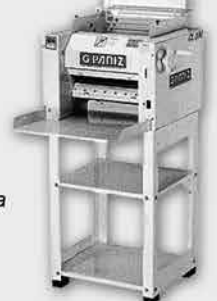
Cilindro Sovador Laminador