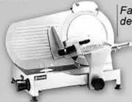
Fatiador de Frios