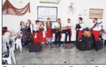
Em ação a tocata do Rancho Raízes de Portugal da Associação dos Poveiros.