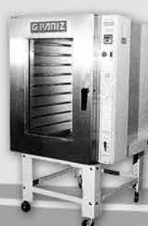
Forno Turbo a Gás