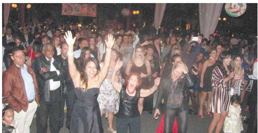
Ani- mação total