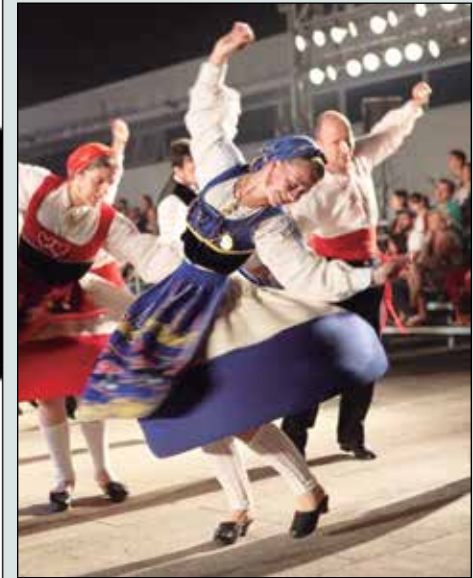
Aqui mais um belíssimo flagrante do amigo e grande fotógrafo lá de Viana do Castelo, o Gualberto Boa-Morte.