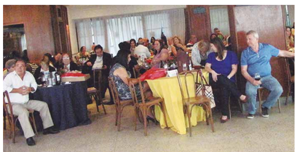
Panorâmica do almoço festivo do Dia dos Pais no Arouca Barra Clube, numa panorâmica das presenças de vários amigos e convidados