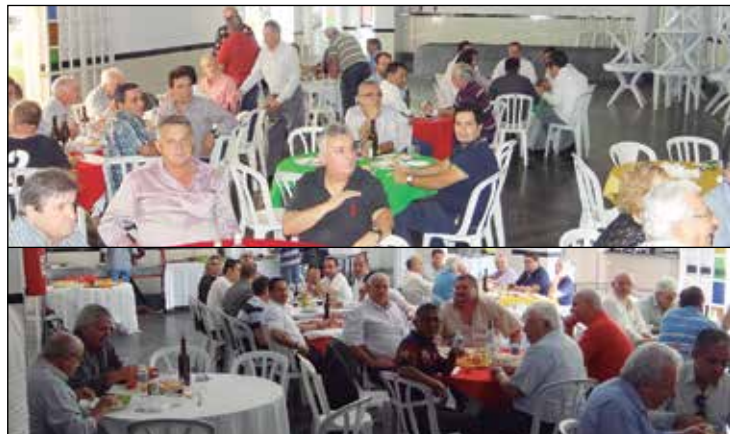
Detalhe dos muitos presentes.