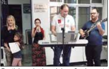
Participando da celebração da santa missa vemos integrantes do Coral da Igreja Nossa Sra. Da Anunciação.