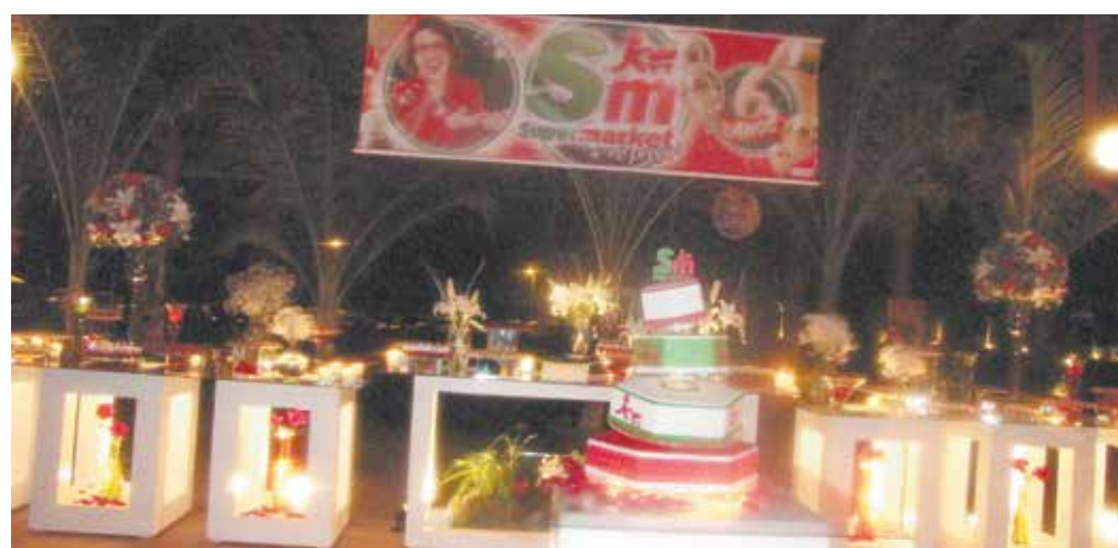
Bolo do 6º aniversário