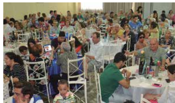
Aspecto do salão social da Casa de Trás-os-Montes recebeu neste domingo em homenagem aos pais diversos associados e amigos

Para apresentar todos os pais, a diretoria ofereceu um animado baile com o Conjunto, Amigos do Alto Minho, arrastando os casais para o salão com um super repertório, que sempre agrada às famílias, em especial, os pais.