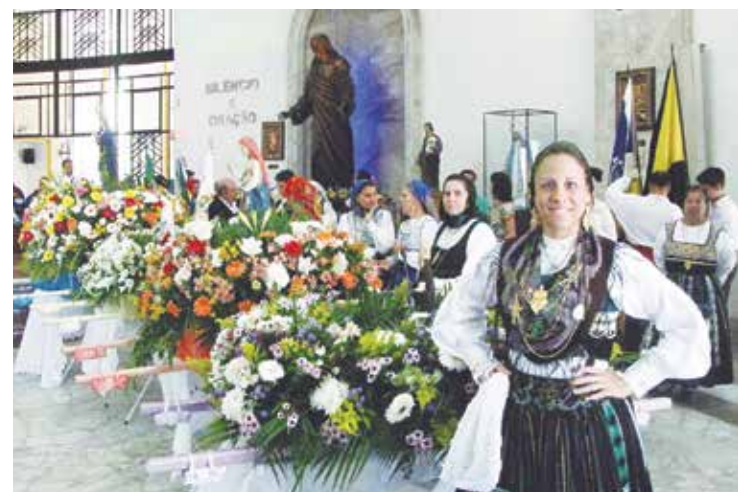
Linda imagem no interior da igreja com as componentes dos Ranchos Folclóricos da Casa do Minho ao lado dos andores com as imagens dos santos

Um domingo de fé e emoção, da família minhota que homenageou a Padroeira da Casa do Minho do Rio de Janeiro, Nossa Senhora do Sameiro, uma belíssima programação. Logo cedo foi celebrada uma Missa em Ação de Graças na Igreja de São Judas Tadeu, no Cosme Velho com a presença da diretoria, associados e amigos. Momento de muita emoção e fé durante a celebração realizada pelo Padre Diegues. Como é