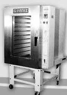
Forno Turbo a Gás