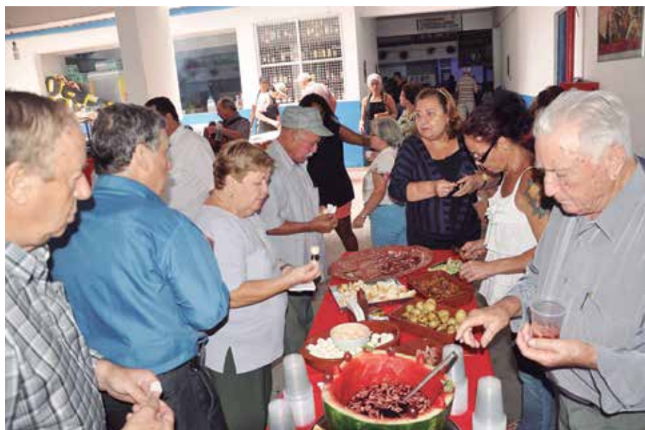
O público se serve a vontade na mesa de aperitivos da Festa Portuguesa