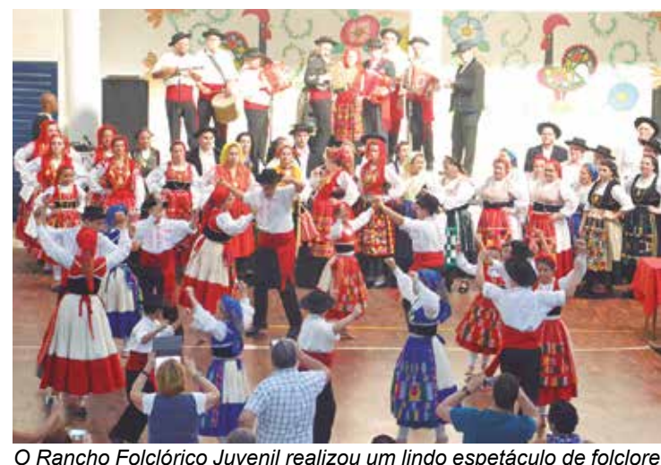
O Rancho Folclórico Juvenil realizou um lindo espetáculo de folclore