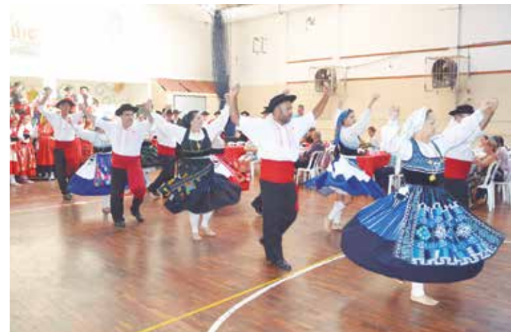
Um verdadeiro espetáculo de folclore realizado pelo Rancho Veterano Minhoto