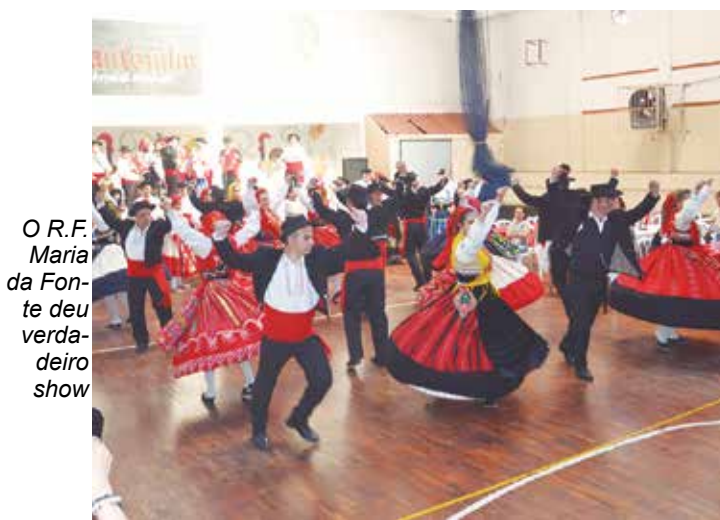
O R.F. Maria da Fonte deu verdadeiro show