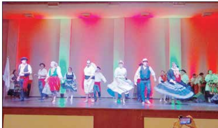
Grupo Folclórico dos Veteranos de São Paulo do Clube Português numa bellissima atuação.