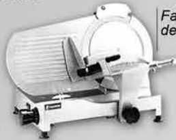
Fatiador de Frios