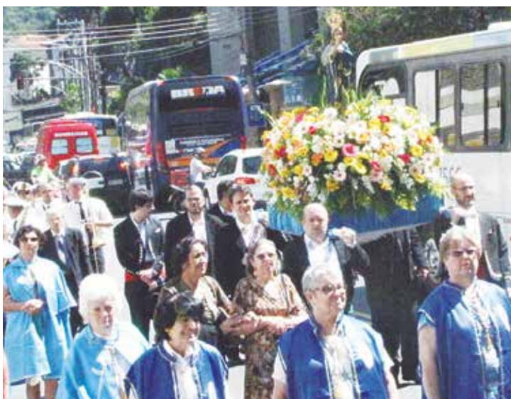
Bela imagem dos componentes do R.F. Minhoto conduzindo os andores de N. S. do Sameiro na procissão logo após a Missa acompanhados pela Banda Irmãos Pepino