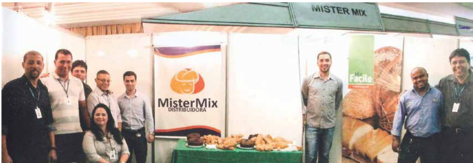
Os Famosos e saborosos produtos Mister Mix sempre presente no dia do Panificador comemorando numa típica Feirinha no Clube Português de Niterói

população mundial. Parabéns ao presidente e toda sua diretoria que proporcionaram estes belos momentos aos amigos.