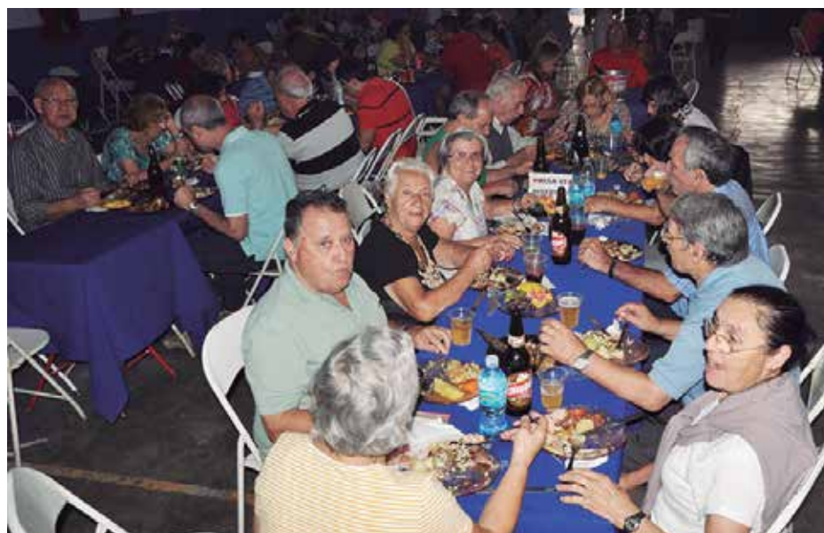
As famílias portuguesas almoçam felizes com a boa música folclórica lusitana