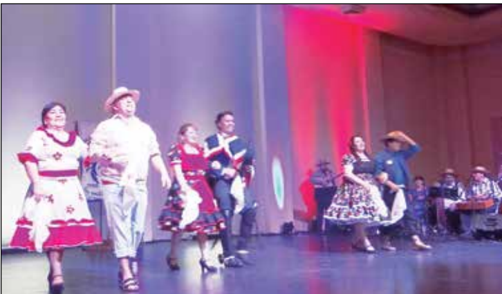
Aqui a exibição do Conjunto Folclórico Chile Lindo.